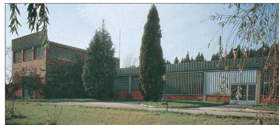
Planta de esterilización